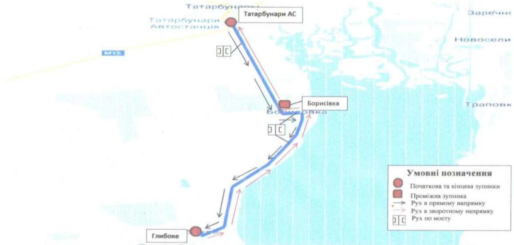
СХЕМА ПРИМІСЬКОГО АВТОБУСНОГО МАРШРУТУ № 36 «ТАТАРБУНАРИ АС - ГЛИБОКЕ»

Керуючий справами (секретар) виконавчого комітету