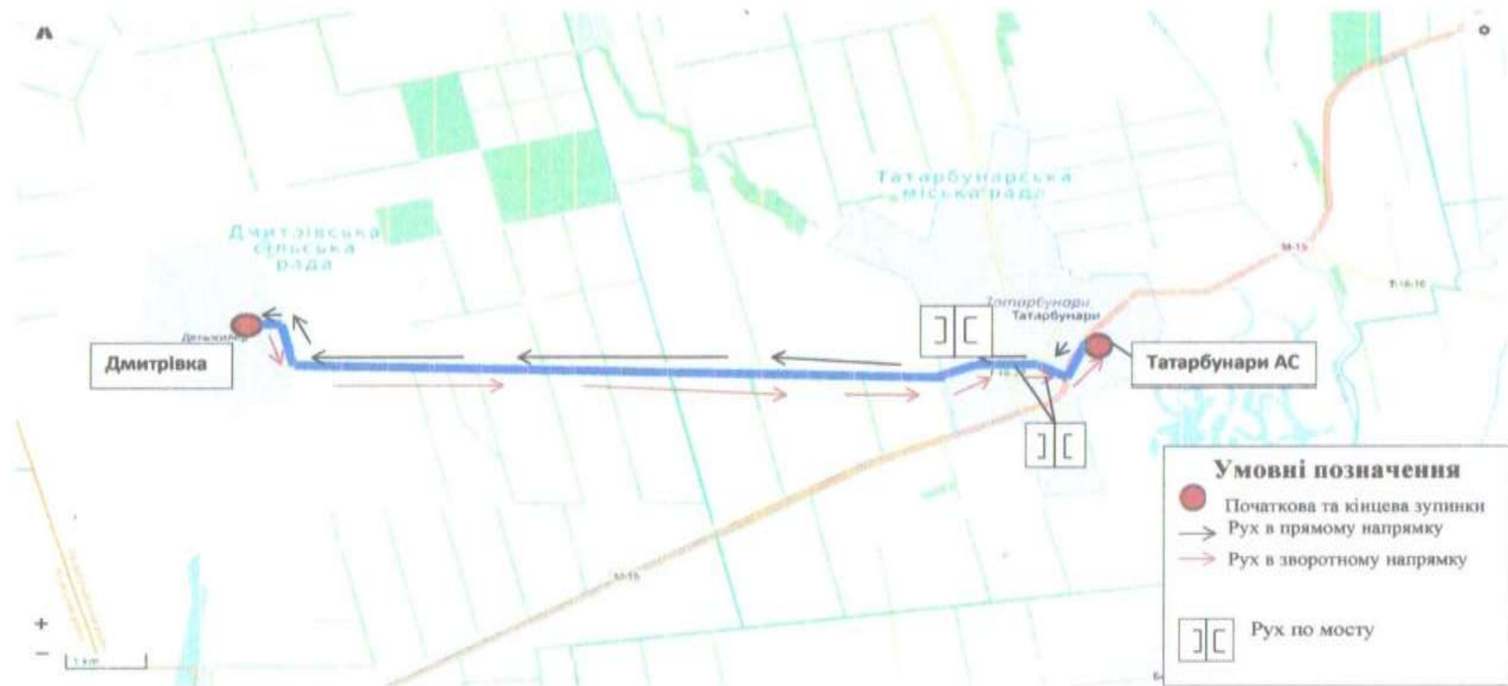
СХЕМА ПРИМІСЬКОГО АВТОБУСНОГО МАРШРУТУ № 25 «ТАТАРБУНАРИ АС - ДМИТРІВКА»

Керуючий справами (секретар) виконавчого комітету